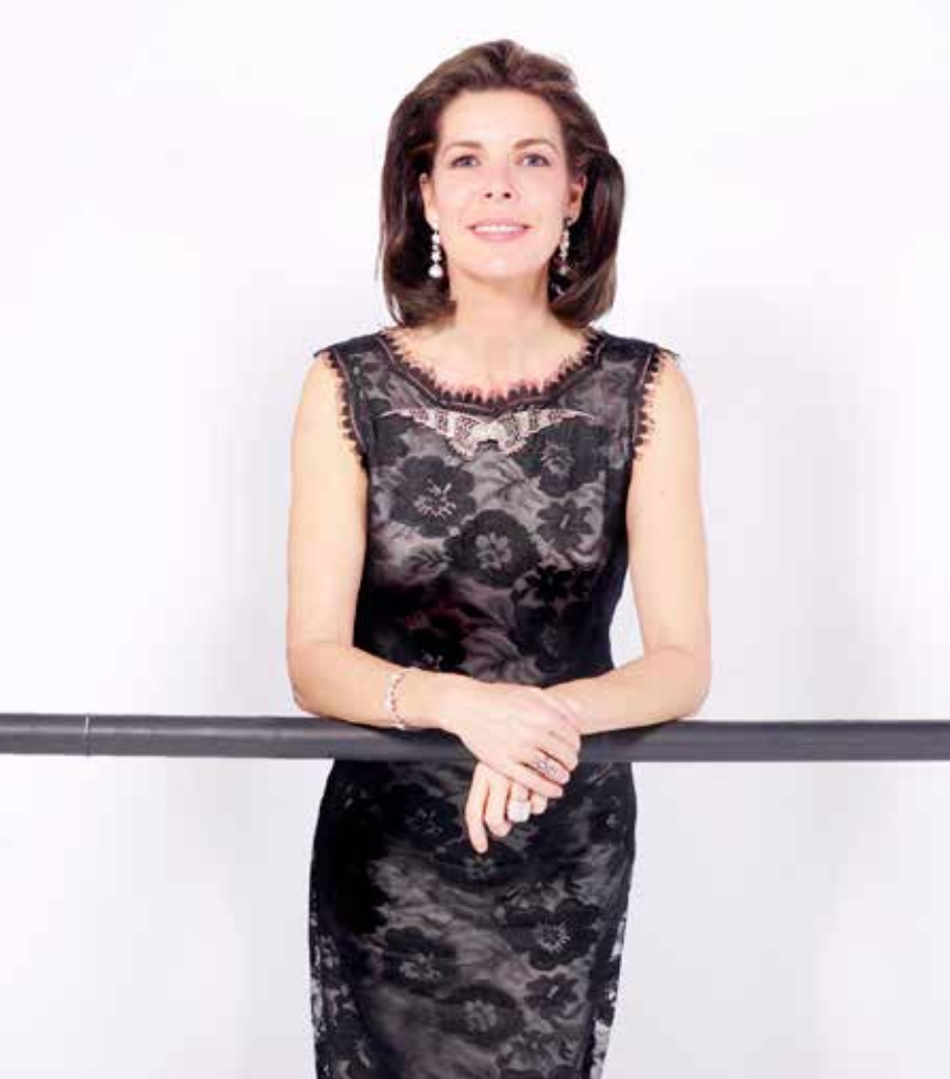
S.A.R. La Princesse de Hanovre

Présidente des Ballets de Monte-Carlo